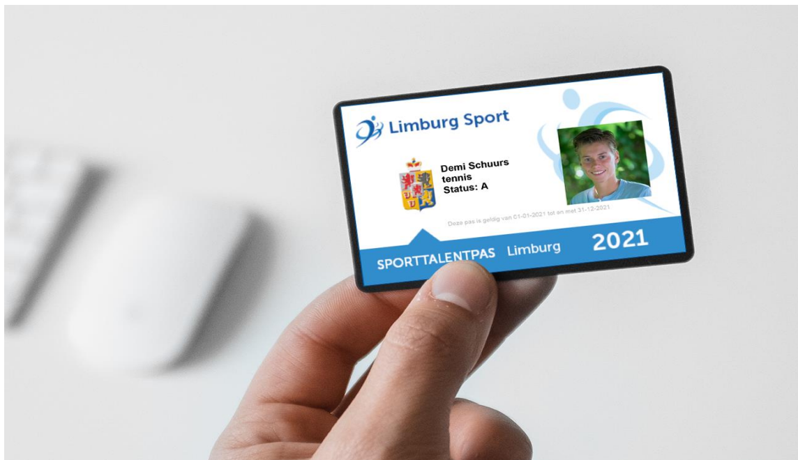
Afbeelding 1. Voorbeeld van een Sporttalentpas 2021